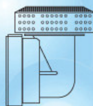
DISPOSITIVO DE SUCCION

En caso de suciedad puede desmontar el frente cromado retirando los tornillos. Durante el baño de hidromasaje, evite tapar la rejilla de succión, ya que se obstruye la motobomba e interrumpe el hidromasaje.