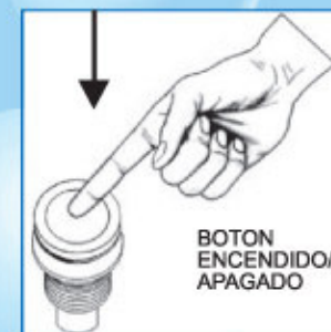
BOTON ENCENDIDO/ APAGADO

PULSADOR DE ENCENDIDO Y APAGADO: El pulsador tiene la función de encender y apagar la motobomba del sistema de hidromasaje. Sólo debe presionar la parte central del pulsador para encender, y presionar nuevamente para apagar. Para limpieza y manutención del pulsador, debe girar hacia la izquierda la parte superior (cromada), se desatornilla, luego retire la parte central cromada. Puede limpiar y lubricar con vaselina líquida las partes móviles del pulsador si es necesario. Para armar junto el botón cromado y la tapa con hilo, presionando hacia abajo y atornille hasta que quede apretado.